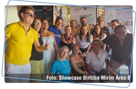
Foto: Showcase Biritiba Mirim Área 8