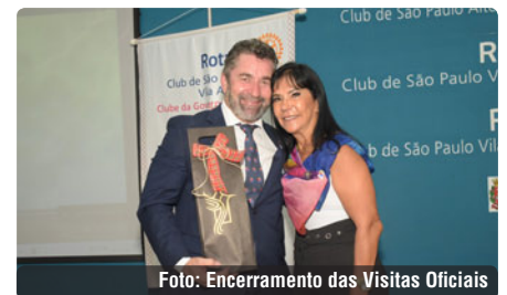
Foto: Encerramento das Visitas Oficiais