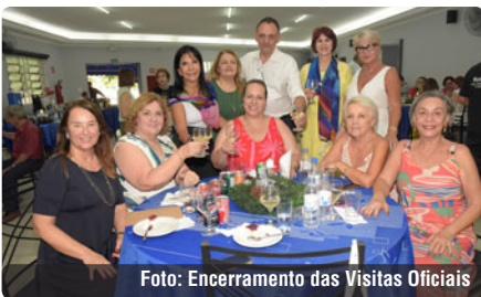
Foto: Encerramento das Visitas Oficiais