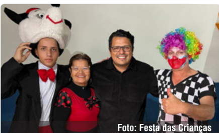
Foto: Festa das Crianças