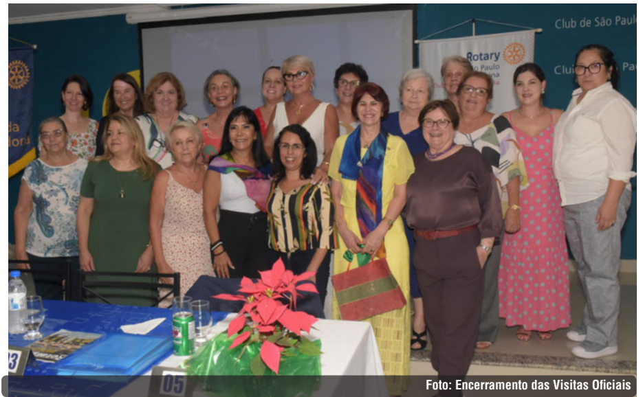
Foto: Encerramento das Visitas Oficiais