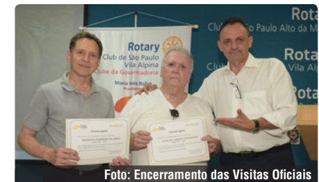
Foto: Encerramento das Visitas Oficiais