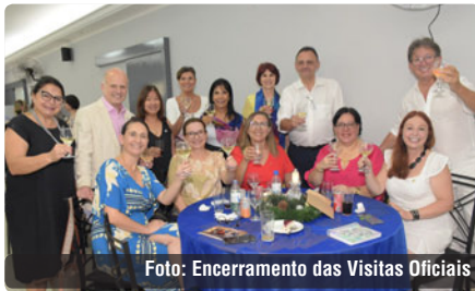
Foto: Encerramento das Visitas Oficiais