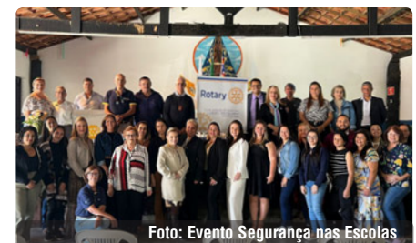
Foto: Evento Segurança nas Escolas