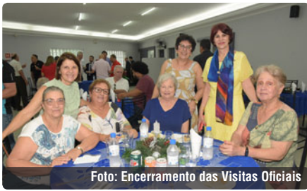
Foto: Encerramento das Visitas Oficiais