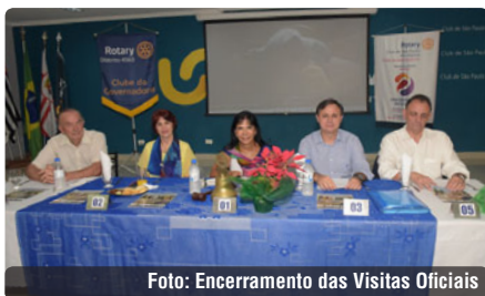
Foto: Encerramento das Visitas Oficiais