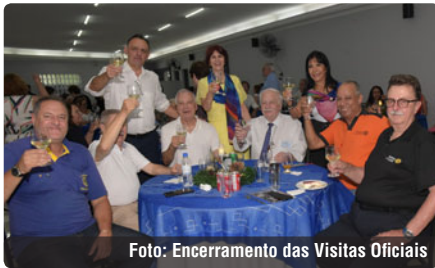
Foto: Encerramento das Visitas Oficiais