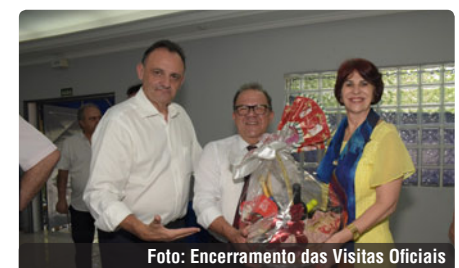
Foto: Encerramento das Visitas Oficiais