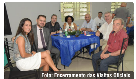
Foto: Encerramento das Visitas Oficiais