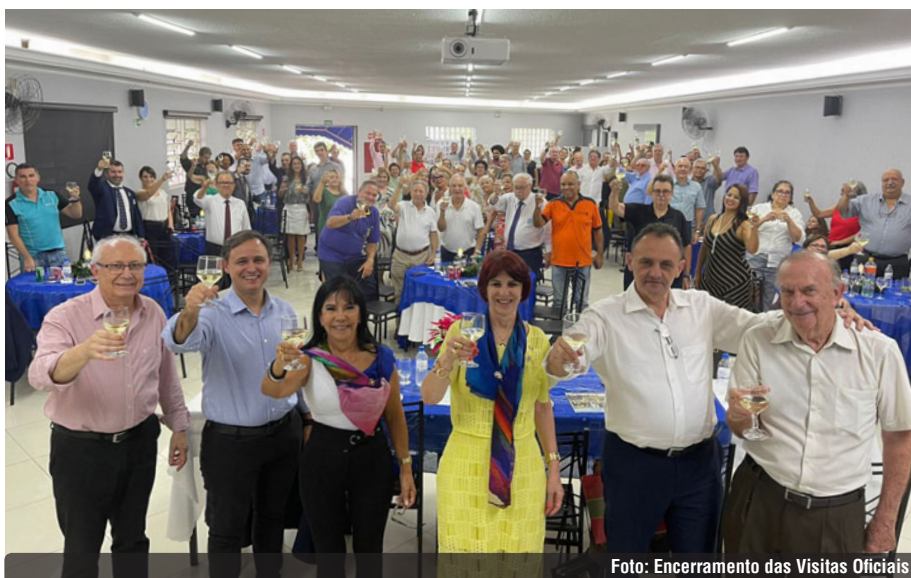
Foto: Encerramento das Visitas Oficiais