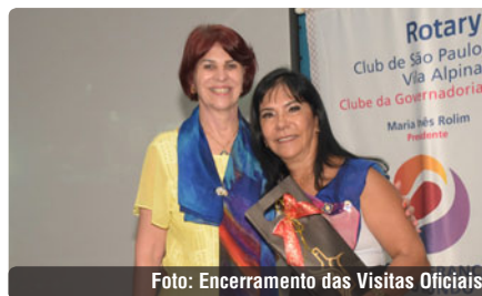
Foto: Encerramento das Visitas Oficiais