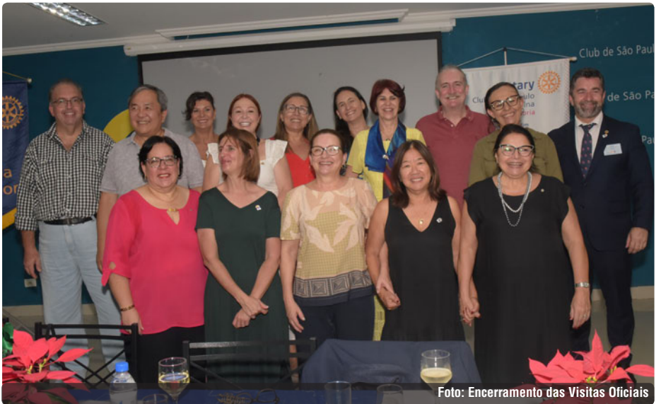
Foto: Encerramento das Visitas Oficiais

tentes e Presidentes dos Clubes no sucesso das visitas. Sua mensagem ressaltou a importância da união e do esforço conjunto em todas as iniciativas realizadas. O evento foi selado com um brinde, um gesto simbólico