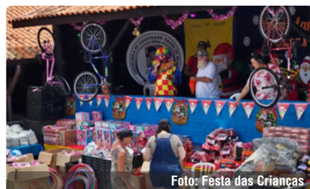
Foto: Festa das Crianças

Projeto Segurança nas Escolas: Um evento de grande relevância que reuniu diretores de escolas, autoridades locais e especialistas abordando estratégias de prevenção à violência e identificação de sinais de risco em alunos.