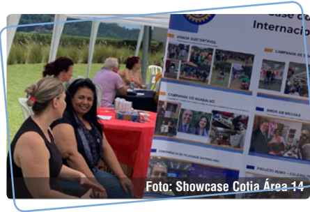
Foto: Showcase Cotia Área 14