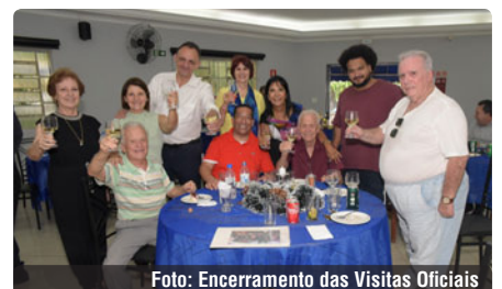
Foto: Encerramento das Visitas Oficiais