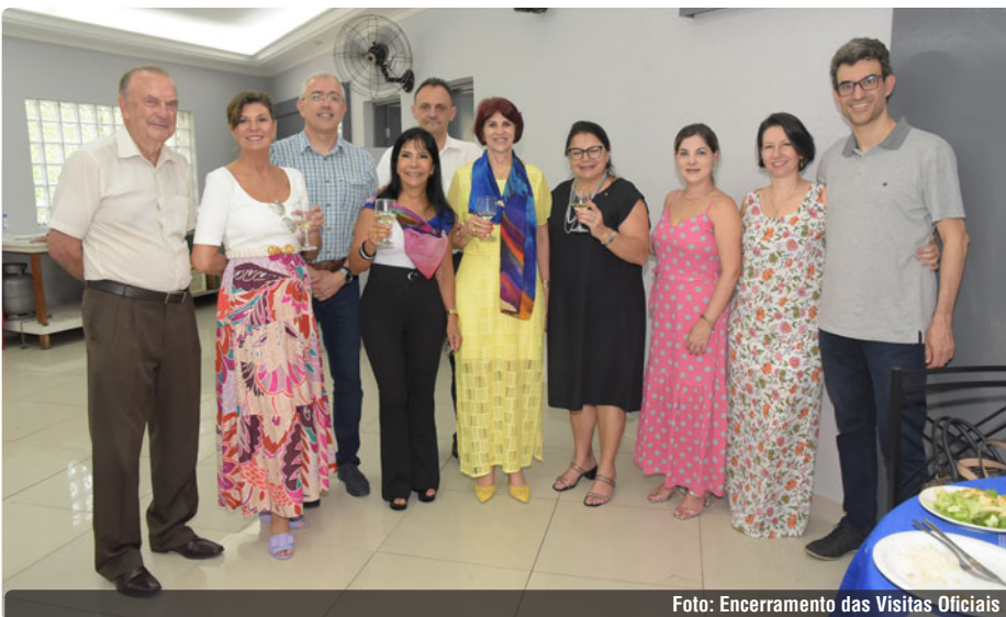
Foto: Encerramento das Visitas Oficiais

e anteciparem os próximos passos com otimismo e esperança renovada. Esse encontro reforçou o compromisso coletivo com os objetivos do Rotary e destacou a importância da colaboração para o sucesso futuro.