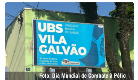
Foto: Dia Mundial de Combate à Pólio

nante, eles convidaram crianças e suas famílias para se vacinarem, ressaltando a importância da imunização para a saúde comunitária.