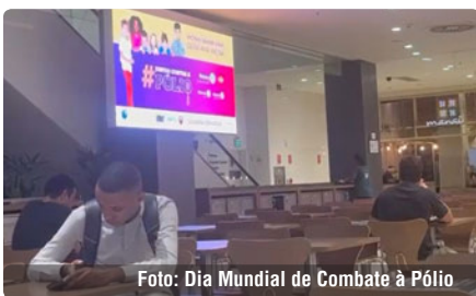
Foto: Dia Mundial de Combate à Pólio

Esta ação reafirma o papel proativo do clube em sensibilizar a comunidade quanto à importância da vacinação.