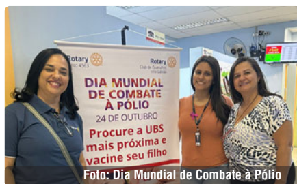
Foto: Dia Mundial de Combate à Pólio

O clube, que já tem um histórico notável de atuação nas campanhas de vacinação em Guarulhos, reforçou sua parceria com as Unidades Básicas de Saúde (UBSs) de Vila Galvão e Jardim Rosa de França para ampliar a divulgação da campanha. Nas redes sociais, o destaque foi a participação entu-