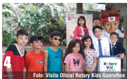
Foto: Visita Oficial Rotary Kids Guarulhos