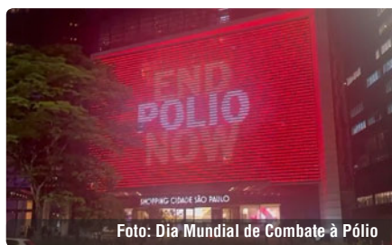
Foto: Dia Mundial de Combate à Pólio