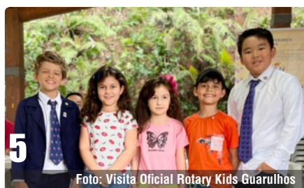
Foto: Visita Oficial Rotary Kids Guarulhos