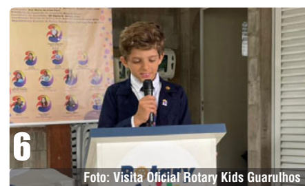
Foto: Visita Oficial Rotary Kids Guarulhos