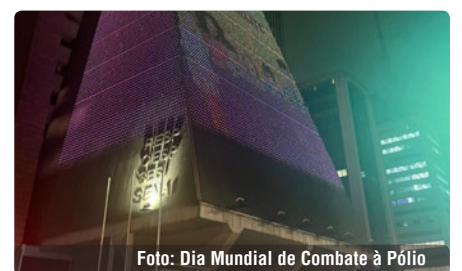
Foto: Dia Mundial de Combate à Pólio