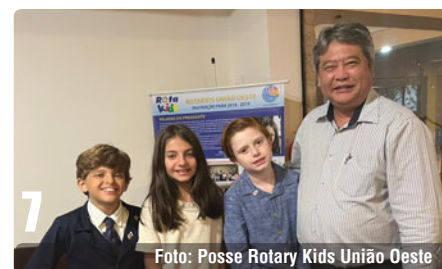
Foto: Posse Rotary Kids União Oeste