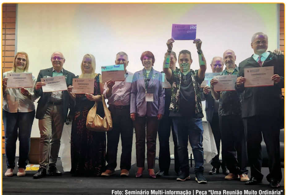
Foto: Seminário Multi-informação | Peça "Uma Reunião Muito Ordinária"