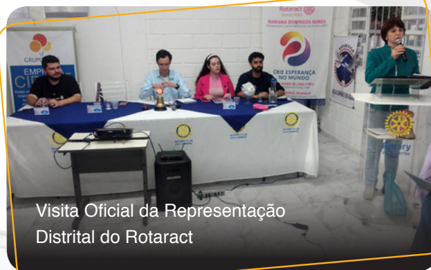
Visita Oficial da Representação Distrital do Rotaract