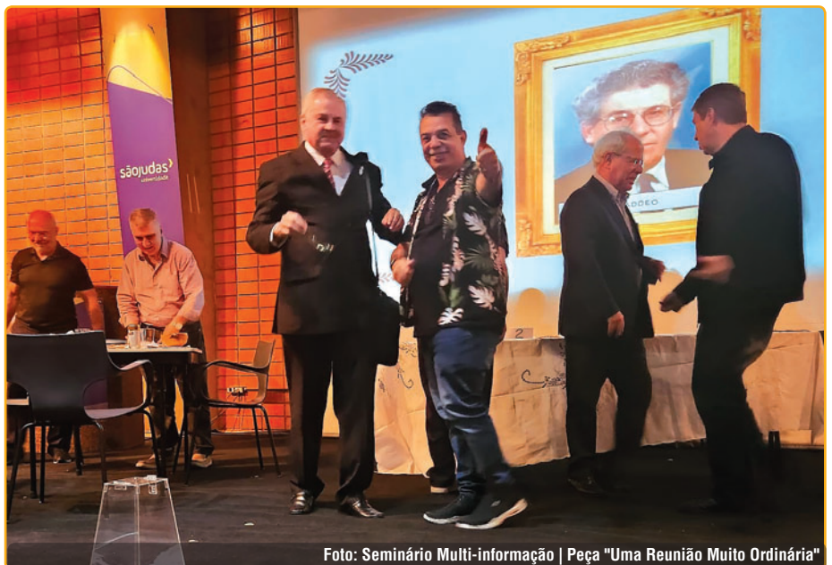
Foto: Seminário Multi-informação | Peça "Uma Reunião Muito Ordinária"