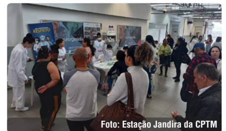
Foto: Estação Jandira da CPTM